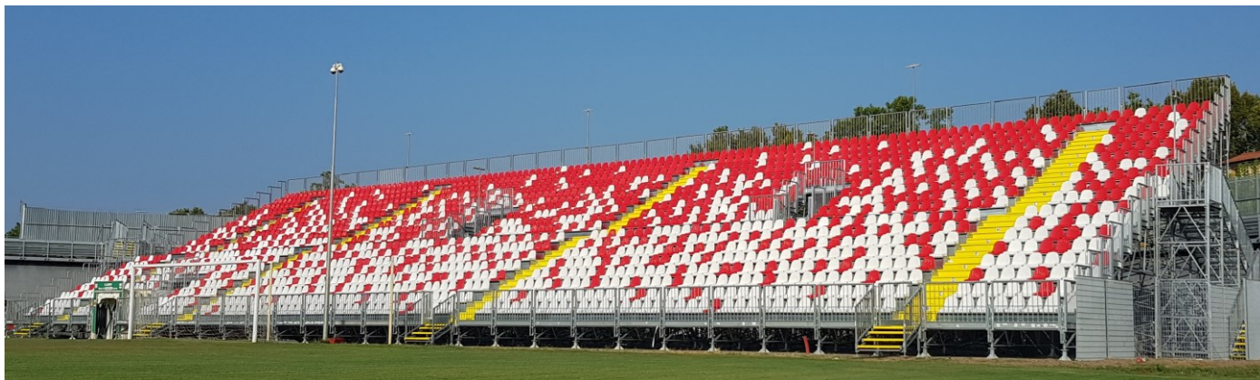
CARPI F.C. 1909 SRL STADIO S. CABASSI CARPI