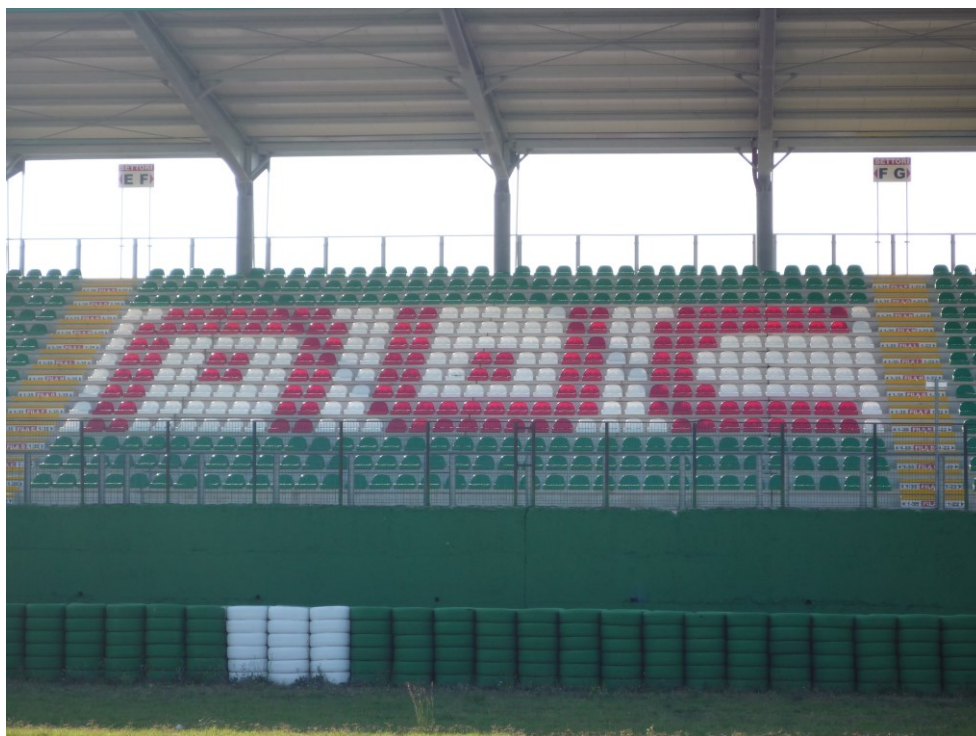
MISANO WORLD CIRCUIT MARCO SIMONCELLI