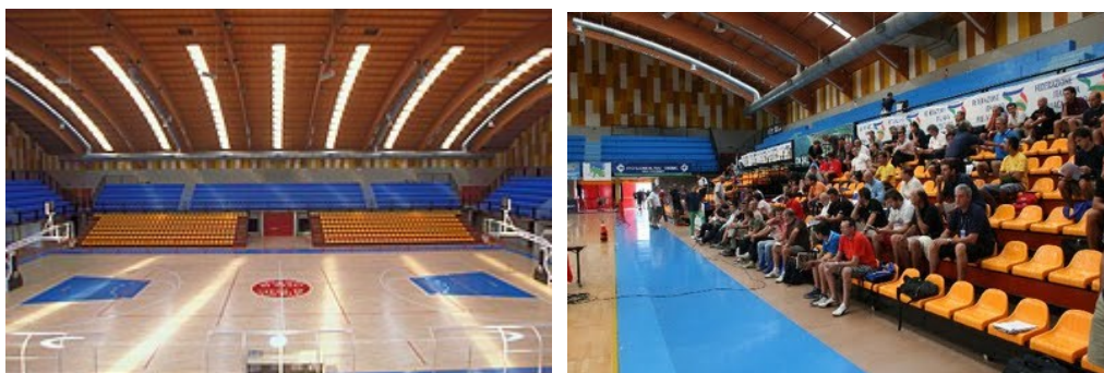
PALAZZETTO DELLO SPORT WALTER VICENTINI DI CAORLE