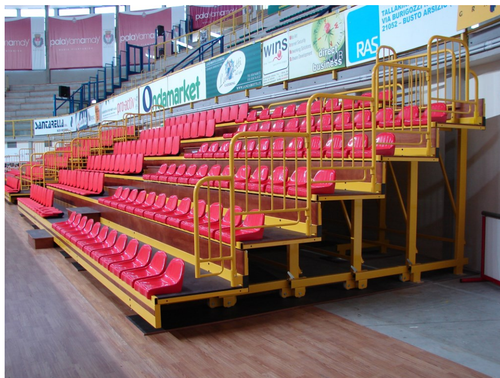
PALAZZETTO DELLO SPORT PALAYAMAMAY DI BUSTO ARSIZIO