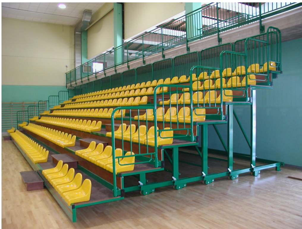
PALAZZETTO DELLO SPORT FORMIGINE